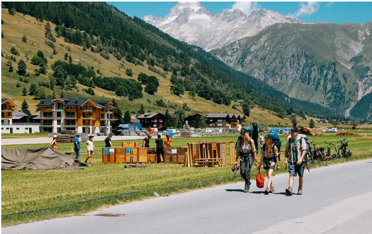
Abbildung 2: Aufbauwoche des Pfadibundeslagers "mova", Sommer 2022 im Oberwallis