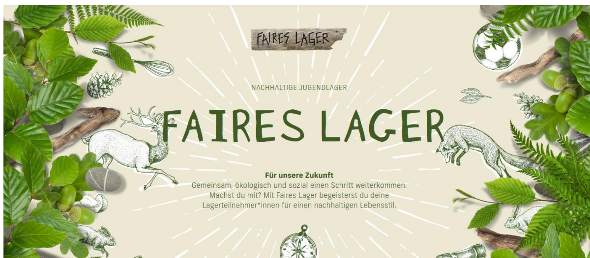
Abbildung 3: Homepage von Faires Lager

Aktuell wird die Website von Faires Lager den Ansprüchen am besten gerecht. Sie wurde in einem umfassenden Prozess mit unterschiedlichen Projektbeteiligten entwickelt und ist darauf ausgelegt, dass die definierten Zielgruppen motiviert und befähigt werden, mit den vielfältigen Hilfsmitteln Umweltaspekte in ihre Aktivitäten zu integrieren. Die Seite ist so aufgebaut, dass die verschiedenen Zielgruppen (Lagerleitung, Küchenteams, Auszubildende, weitere Interessierte) durch die Thematik und hin zu den für sie relevanten Hilfsmitteln geführt werden. Die Hilfsmittel können einerseits direkt heruntergeladen werden, andererseits sind sie eingebettet in die Abläufe der entsprechenden Zielgruppen, z.B. in den Lagerplanungsprozess.