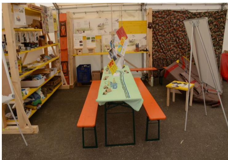
Abbildung 4: Umweltzelt im mova, Foto Isabelle Vieli / Allegra

Die Erkenntnisse und Ergebnisse des Umwelt-