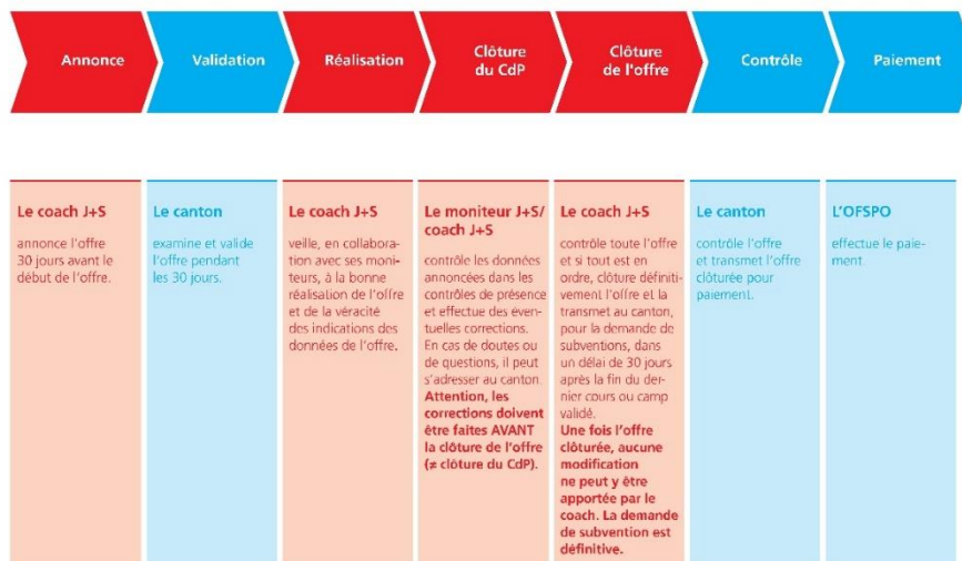
Fig. 1: Procédure d'une offre J+S

La validation et le contrôle des offres du GU 4 des cantons et des fédérations sportives nationales se font par l'OFSPPO.